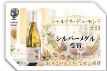
シャルドネ・デュ・モンド 2022 シルバーメダル 受賞 日本のワイナリーで唯一受賞